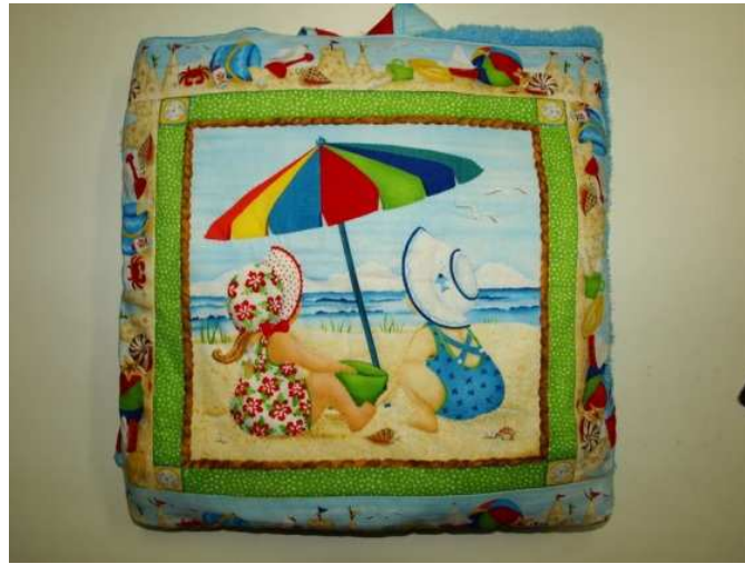
Mochila-toalla vista de frente

Siguiendo estos pasos conseguiréis realizar una preciosa mochila toalla para que los más peques la puedan utilizar en la playa o en la piscina.