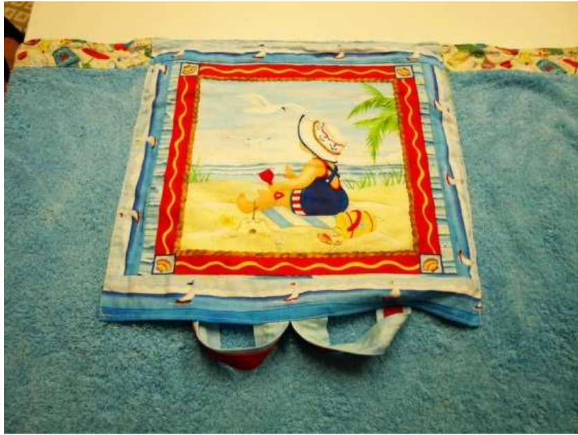
Detalle de la mochila

En el centro de la toalla se coloca la mochila, la parte externa con la toalla. Y cosemos 3 partes.