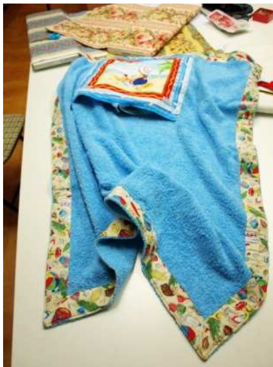
Detalle del borde de la toalla

Se cose la parte exterior de la mochila con la parte interna, colocando las asas donde corresponde. Las asas quedan dentro hasta que le das la vuelta a la labor. Se cosen los 4 lados dejando un trozo para darle la vuelta. Tened cuidado con la telas con dirección, como es el caso.