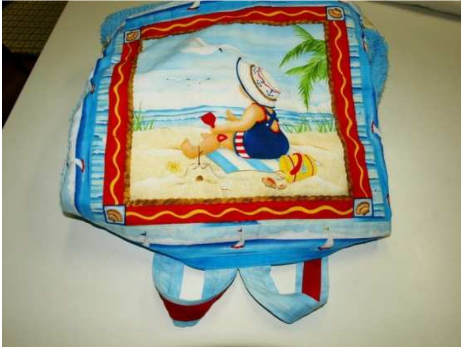
Vista de la mochila por la parte interna

Se cose la parte exterior de la mochila con la parte interna, colocando las asas donde corresponde. Las asas quedan dentro hasta que le das la vuelta a la labor. Se cosen los 4 lados dejando un trozo para darle la vuelta. Tened cuidado con la telas con dirección, como es el caso.