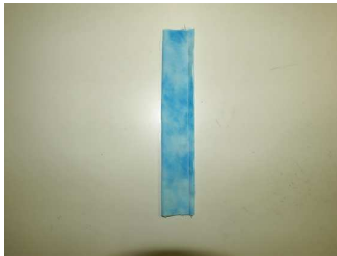
Tira azul para las asas

Preparamos la parte exterior de la mochila. A nuestra es de 35x35cm.