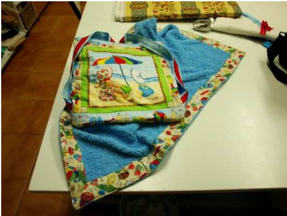
Resultado final: mochila-toalla.

En el centro de la toalla se coloca la mochila, la parte externa con la toalla. Y cosemos 3 partes.